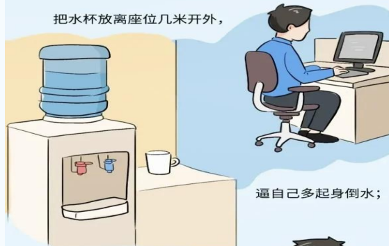
把水杯放离座位几米开外，