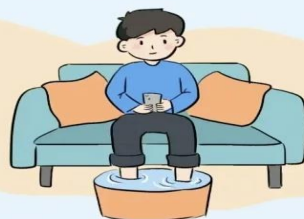
甚至连泡脚时坐着刷短视频也算！

最扎心的是，老年人常犯“沙发依赖症”，一坐就是一下午，结果痴呆风险比年轻人更高。