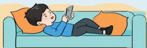
就连吃饭都恨不得让外卖直接送到楼底下。