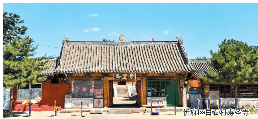
忻府区白石村寿圣寺

豆罗镇作为忻府区八个古镇之一,2016年被确定为全国重点镇,这为豆罗镇高质量发展带来了良好的机遇。