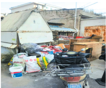
和平东街玻璃厂宿舍杂物随意堆放