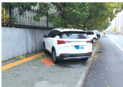
福慧路惠民小区西侧车辆占用人行通道