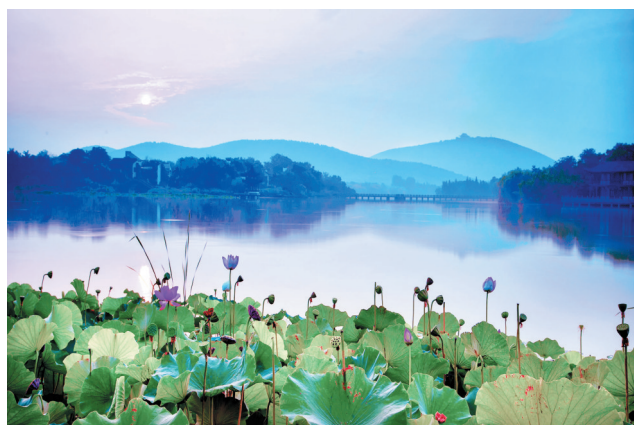
荷塘月色