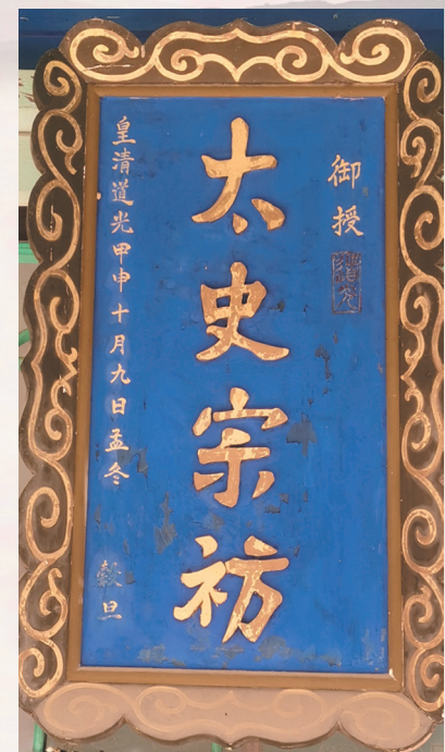
清道光皇帝为郭氏宗祠题匾