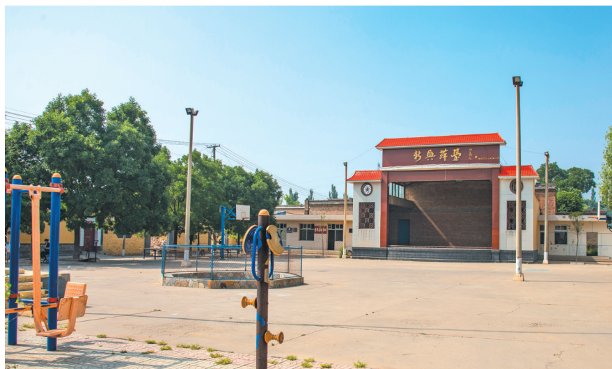
新兴舞台