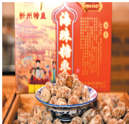
麻会糖枣

2006年，麻会村被列入全省首批新农村建设试点村。在村党支部坚强领导和广大干部群众共同努力下，新农村建设日新月异，成绩斐然。全村新增管灌3000多亩，解决了浇地难的问题。河滩造地500亩，新增了耕地面积。坚持以市场为导向，调整产业结构，大力发展“两高一优”农业项目，突出生态园林建设。生态旅游与古迹观光成为麻会村的新兴产业。修建了3200平方米的健身休闲娱乐广场，新设了篮球场、乒乓球台，安装配套了健身器材50余件。建成2000平方米的文化活动中心，配备了网络文化室、图书室、远程教育室和科技培训室等设施。硬化了村里主要街道。修筑了13公里的环村旅游路。开展了主要街道亮化工程，安装路灯50余盏。进行了环村绿化，主要街道和场所实现了绿化美化。落实卫生责任制，统一规定了全村卫生日。设立了垃圾收集点，配备专人专车定时清运。开展了“一气三改”工作，新建5座沼气池，已全部投入使用，效果良好。如今麻会村民过上了好日子，生活比蜜甜。