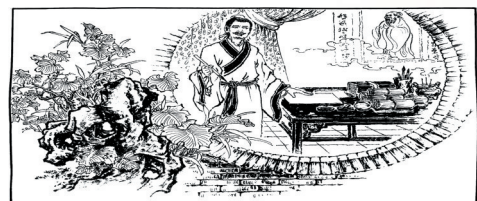
7. 数年后,郝隆离乡南下为官,这位孩子也成为当地的儒士。