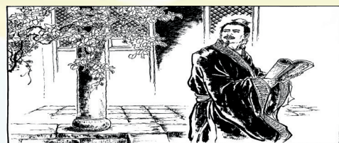
1. 郝隆,字佐治,今原平市同川人,为东晋名士。年少时曾在家乡开设私塾教书育人。