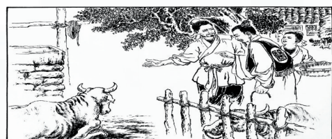
4. 一日,来了一位骑牛行医的郎中,发现病牛颇感兴趣,说愿将所骑之牛换得病牛,农人大为诧异。