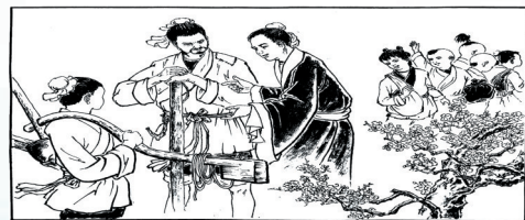
2. 本村有一孩子,聪慧过人,因家穷未入学。郝隆提议让孩子免费就读,但其父仍不同意。