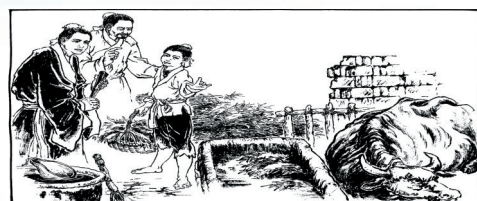
3. 原来农人不愿无故受人施助,但是家中唯一的老牛病倒,只得让孩子帮忙耕田犁地。