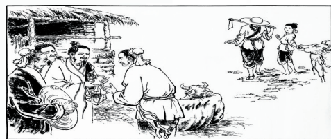
5. 郎中说:“此病牛体内有牛黄,可为药用,愿再添五百文相换。”农人暗自欢喜,二人很快成交。