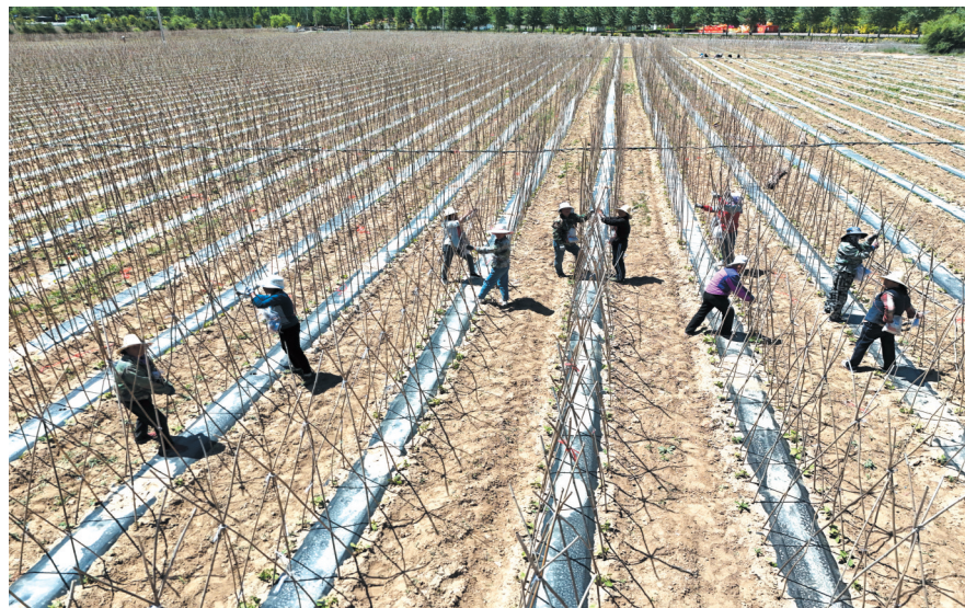
静乐无丝豆角丰润村种植基地

丰润镇沿汾河平川地带除了杨、柳树等常见树种外，五角枫、竹叶青、桑树等也长势繁茂，而这些树种在静乐县其他地域则难以存活。丰润种植的李子、雪梨果实饱满多汁，口感清甜醇厚，加上金黄酥脆、软糯香甜的油炸糕，这三样被称为“丰润三宝”。前润子村手工酿制的黑酱和醋，受到周边人们的青睐，已成为丰润镇的一大特色产品，特别是把黑酱和山药、粉条、白菜、小炒猪肉、黑豆腐烩在一起，那才叫个香啊！