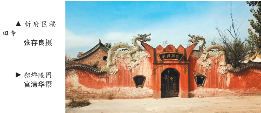
▲ 忻府区福田寺