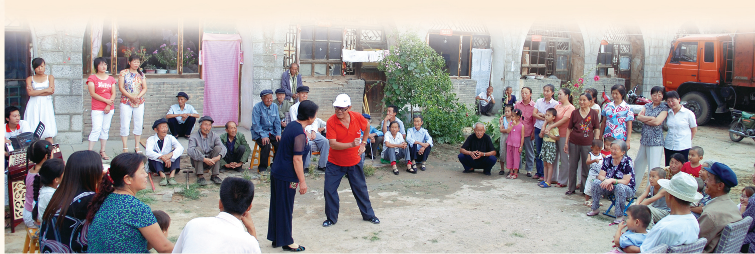
根植于民间的民歌二人台