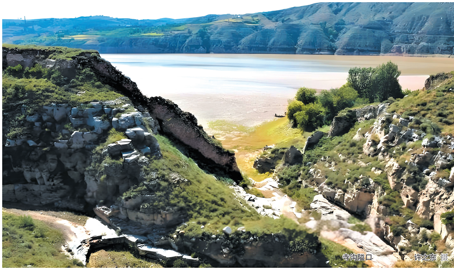
寺沟隘口

忻州日报社出版 第988期 总第12378期 国内统一连续出版物号:CN14-0026 代号:21-20 今日4版