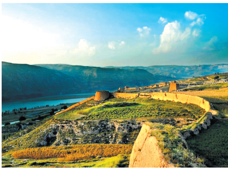
寺沟长城

明代称长城为“边”或“边墙”，就其功能和规模而言，可分为“大边”“小边”“二边”等，一般长城的防御体系中存在两道平行或分岔的长城，靠近塞外（北方）一侧的被称为“外边”（即“外长城”），如本文提到的“大边”“二边”“三边”“四边”，而靠近内地（南方）一侧的则称为“内边”（即“内长城”），儒学大家吴道镒在其所著《明史乐府》中称“不曰长城曰边墙”。