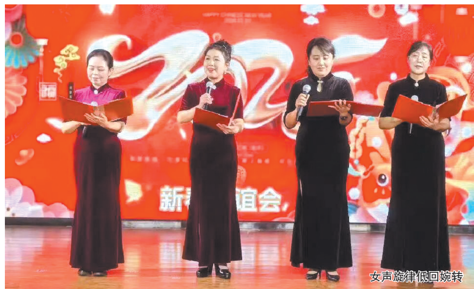
女声旋律低回婉转