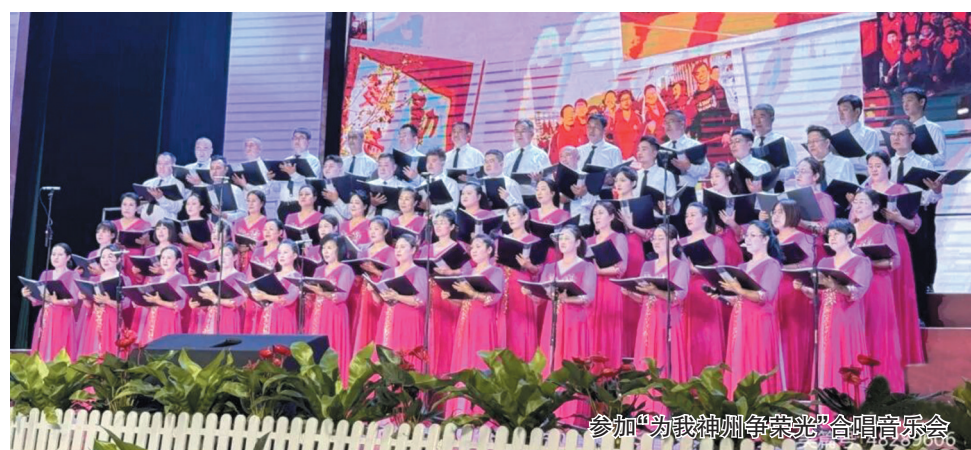
参加“为我神州争荣光”合唱音乐会