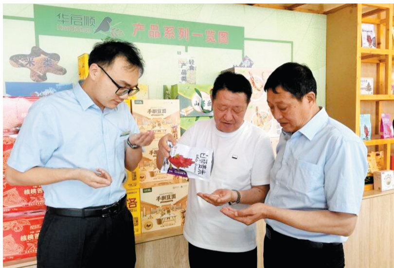
农行客户经理走访藜麦生产企业

依托科技赋能和资金支持,一粒粒藜麦变身备受欢迎的网红减脂产品。目前,该企业已建有杂粮谷物