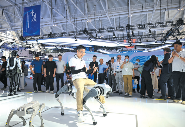
5月28日,观众在综合馆河西展区参观四足机器人载重展示。

5月28日,2026世界智能产业博览会在国家会展中心(天津)开幕,本届博览会以“智行天下 能动未来”为主题,举办展览、赛事、对接交流、互动体验等活动,推动人工智能技术突破、场景落地与生态构建,打造智能产业国际化高端交流合作平台。