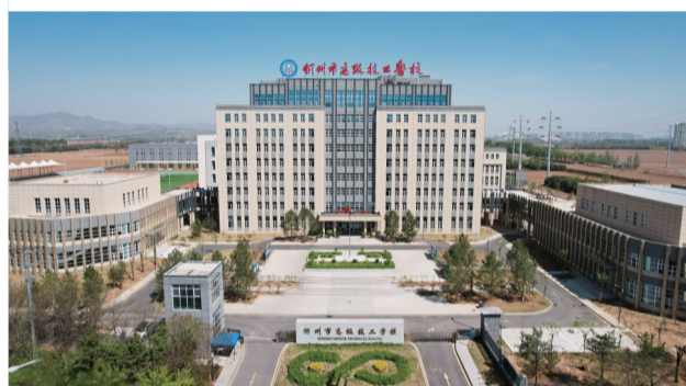
提质焕新的忻州市高级技工学校