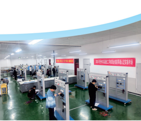
学校积极承担社会职业技能等级认定工作