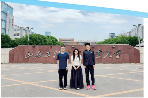
学生对口升学考入山西工程科技职业大学