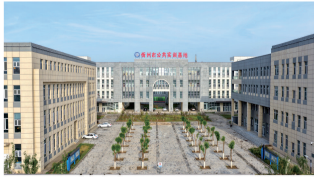
忻州市公共实训基地