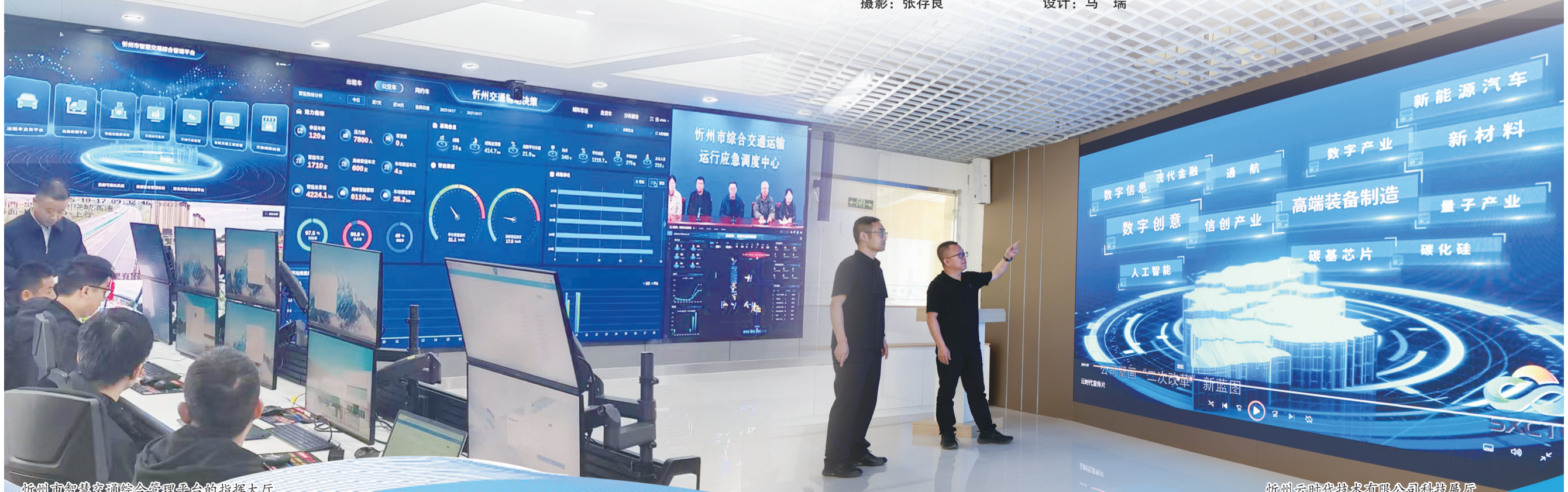
忻州市智慧交通综合管理平台的指挥大厅