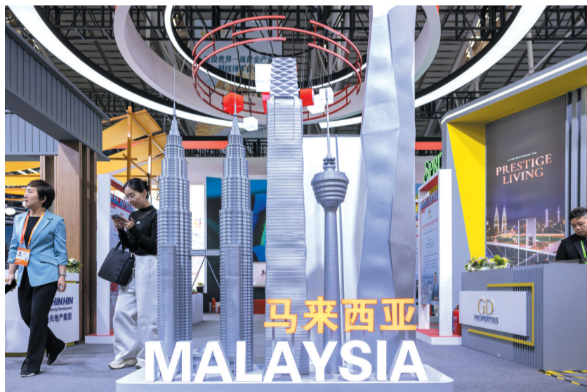
5月19日,参会者在第十届中国—俄罗斯博览会上参观马来西亚展区。新华社记者 张涛 摄

正在哈尔滨举行的第十届中国—俄罗斯博览会上,从智能机械设备到特色文化工艺品,从跨境电商新业态到免签文旅新模式,汇聚全球资源的各类成果集中亮相。历经十届发展,中俄博览会已成为深化中俄经贸合作的重要载体,为企业对接供需提供高水平开放平台。