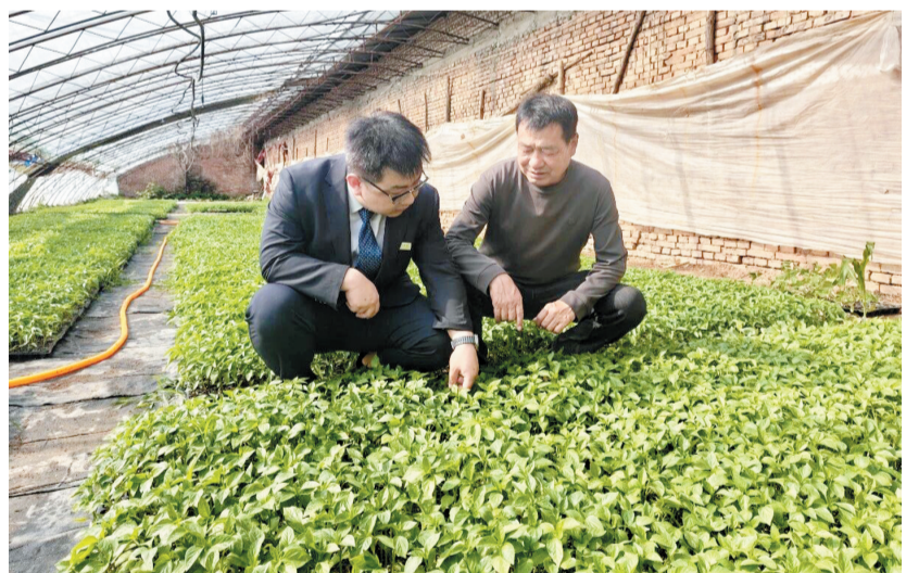
金融活水助农兴企

今年以来,原平农商银行立足本地产业发展实际,持续加大信贷投放,优化金融服务举措,以金融活水精准赋能“三农”发展与乡村振兴,推动普惠小微贷款稳步增长,助力地方实体经济提质增效。