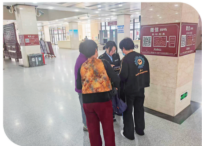
帮助游客线上购票