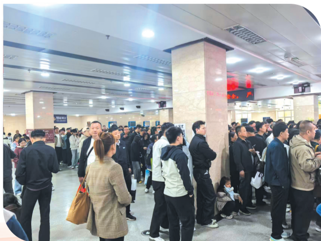
游客有序排队等候