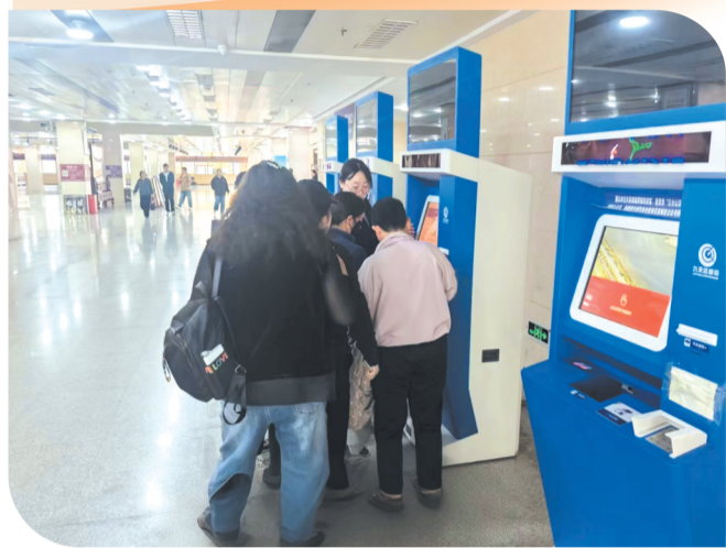
帮助游客快速完成购票