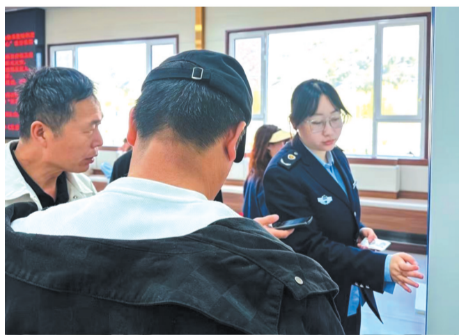
耐心解决游客的问题