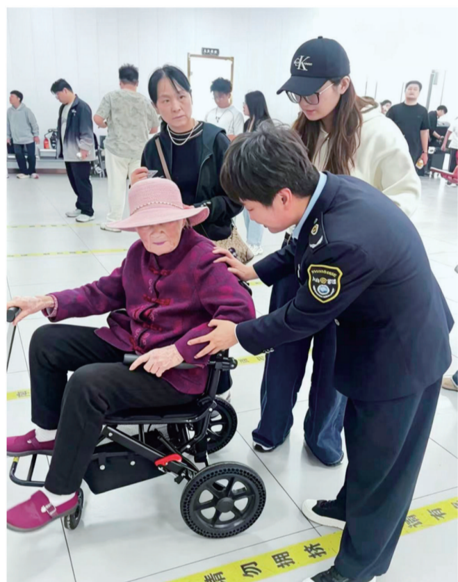
帮助行动不便游客通行