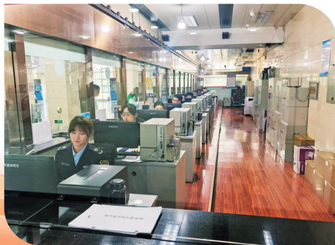
准备就绪,迎接游客