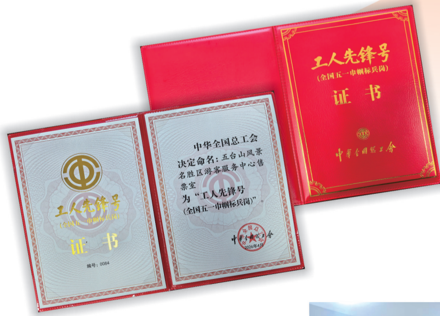
文/郭栋 五台山风景名胜区游客服务中心售票室

清风拂山岗,巾帼绽芳华。五台山风景名胜区游客服务中心售票室这支巾帼队伍,将以荣誉为动力、以使命为担当,继续坚守岗位、精进服务品质,以更饱满的热情、更务实的作风,守护好景区“第一窗口”,书写新时代景区女职工劳动建功、服务为民的最美篇章。