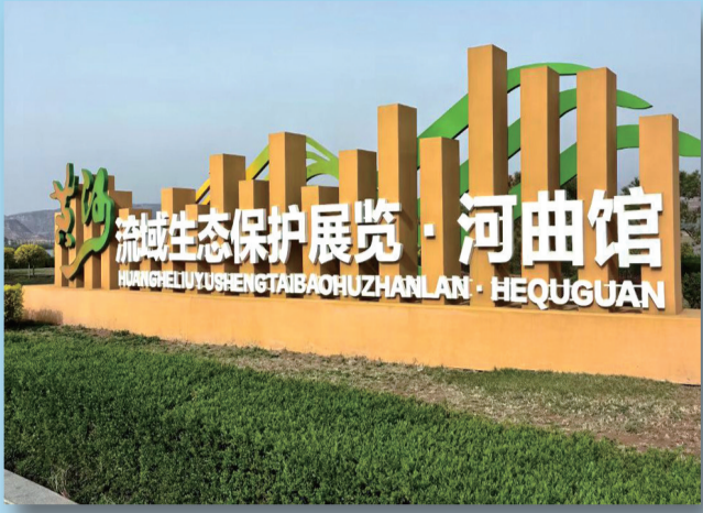
黄河流域保护展览河曲馆。