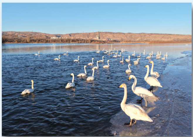
天鹅栖息于黄河河曲段。