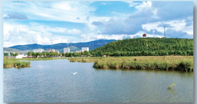
神池县西海子。

站在新的起点,忻州将继续以黄河为卷,以奋斗为笔,在黄河流域生态保护中勇担使命,让每一段河岸都有绿意守护,这便是忻州对母亲河的庄严承诺。