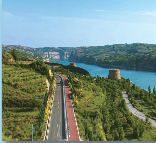
偏关县黄河、长城与旅游公路相映成辉。