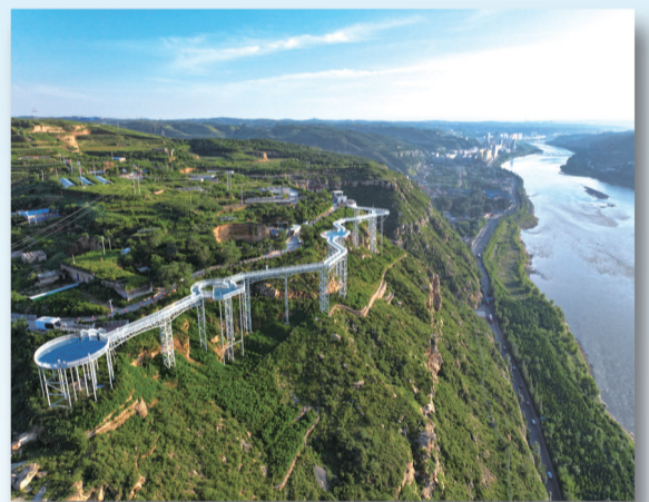
保德县庙峁村玻璃栈道。