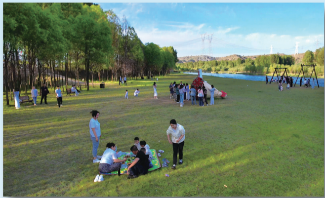
静乐县汾河川国家湿地公园。