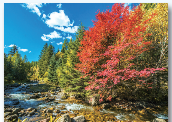
五寨沟美景。