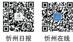
忻州日报 忻州在线