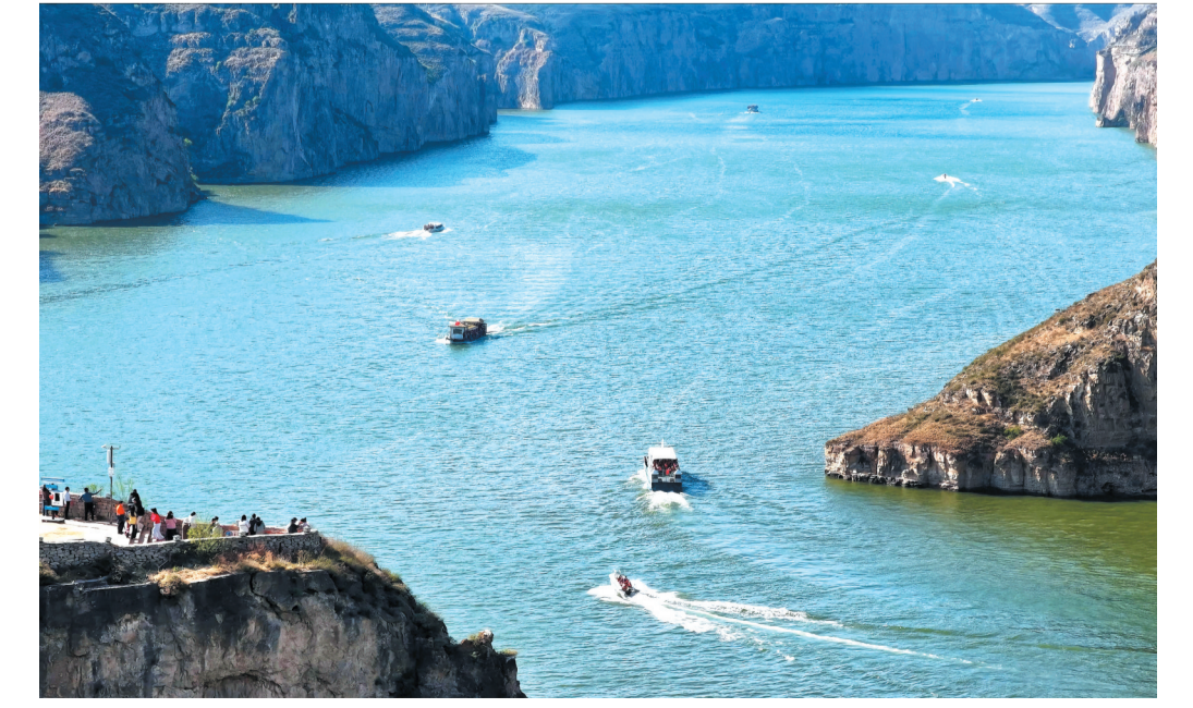
“五一”假期,偏关县老牛湾景区风光无限,活力迸发。图为游客畅游老牛湾。

刚刚过去的“五一”假期,忻府区奇村镇文旅市场热度爆棚,共接待游客40569人次,同比增长55%;总营业收入328.2万元,同比增长38%。假期期间,温泉旅游度假区的游客络绎不绝,共接待游客27739人次,其中住宿游客17150人次、散客10589人次。除了温泉,奇村镇多元文旅业态同样吸睛。双乳湖碧波荡漾、风光秀美;道东风景区山林葱郁、溪流潺潺;鱼龙沟露营地帐篷林立、氛围感拉满。共计接待游客12830人次。爆火的背后,是全市文旅产业的持续发力。自2024年忻奇大道开通以来,温泉民宿如雨后春笋般兴起,行业管理持续加码、服务品质提档优化,游客量逐年增加。这个“五一”,奇村镇以“温泉+”“生态+”模式,让游客既能感受到“温泉仙境”的独特魅力,又能领略奇山奇水的神韵,成功引爆假日文旅市场。(赵曼君)