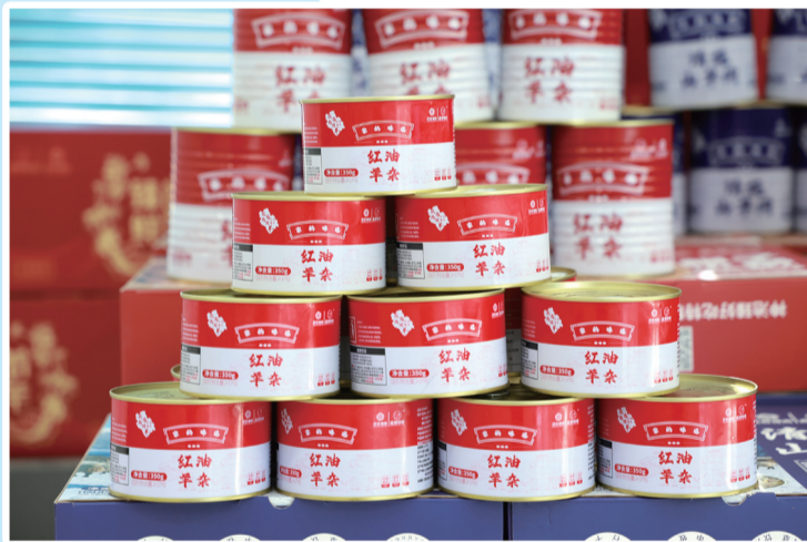
天牧生物科技有限公司的“红油羊杂”罐头。