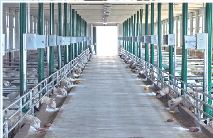
东元农牧科技有限公司的标准化羊舍。