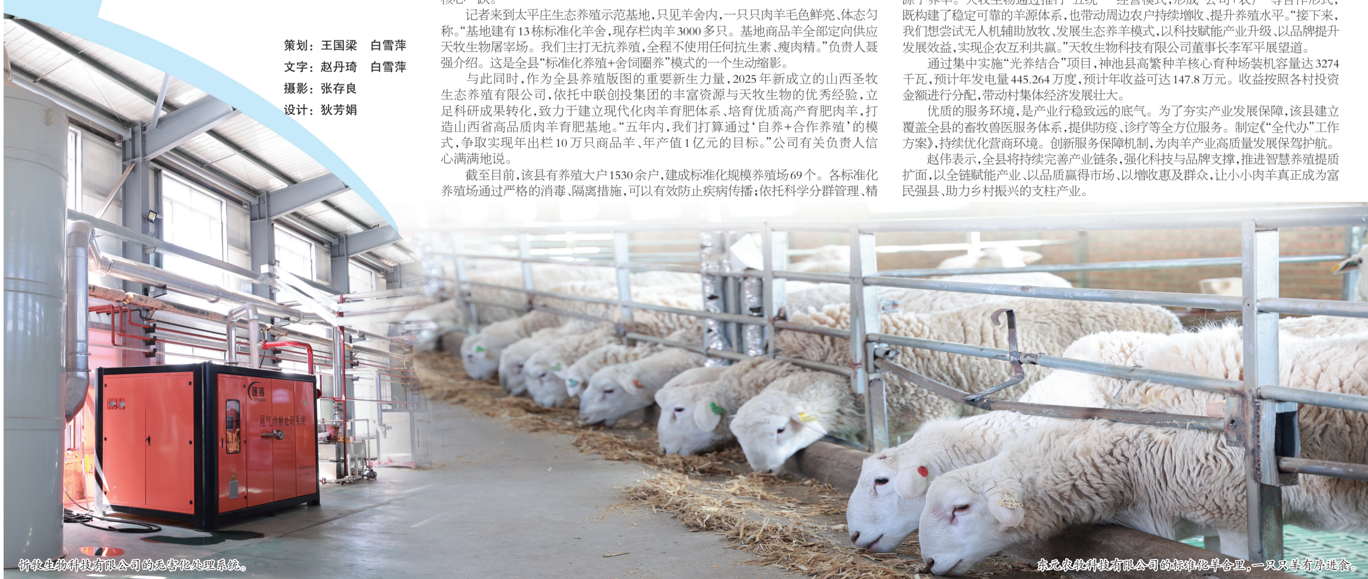
忻牧生物科技有限公司的无害化处理系统。