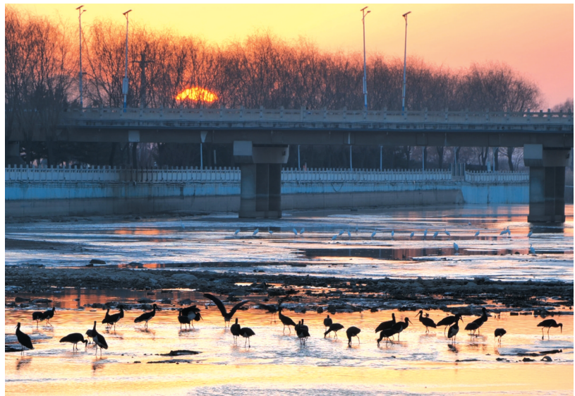
黑鹳在繁峙县滹源景区的浅水中觅食、嬉戏。