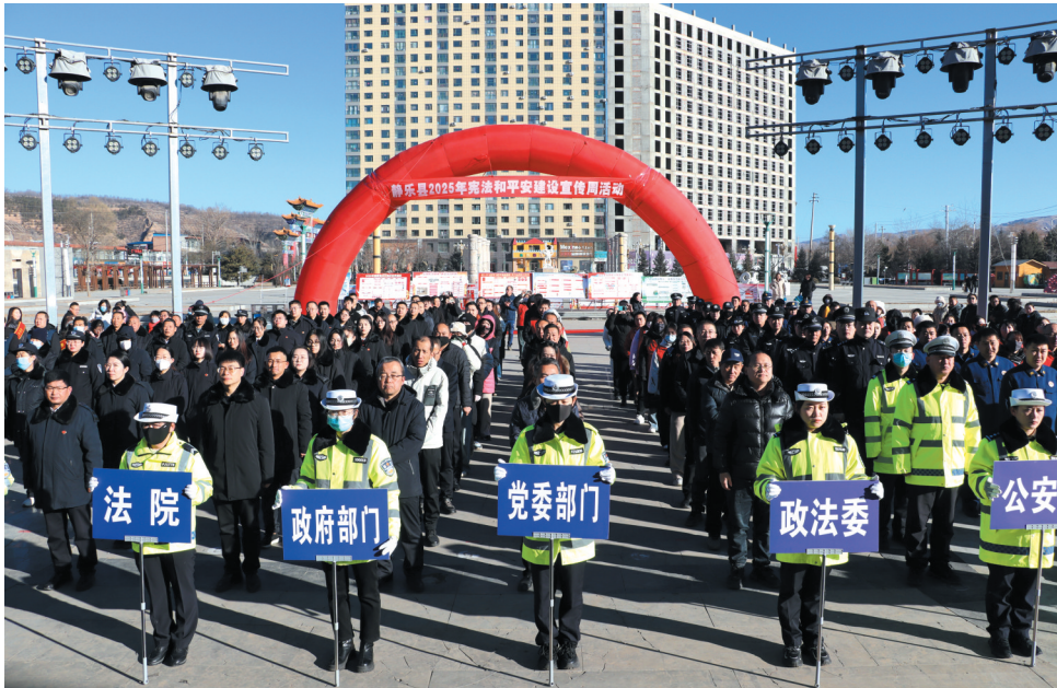
12月4日,静乐县“宪法活动周”及“平安建设宣传周”启动仪式在河西文化广场举行。全县45家党政机关、群团组织和事业单位工作人员参加,并开展“万人大签名”及普法活动。

此次“宪法宣传周”系列活动覆盖面广、针对性强,让宪法精神走入了百姓生活,为深化法治建设奠定了坚实基础。(杨 怡)