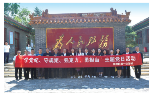
开展主题党日活动