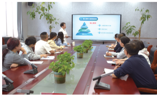
教育专家悉心指导