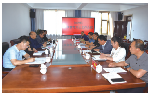
中学教育集团工作会议