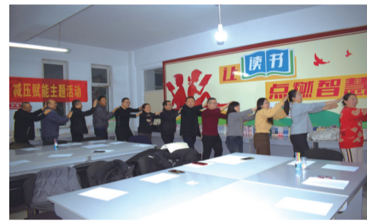
教师心理减压活动