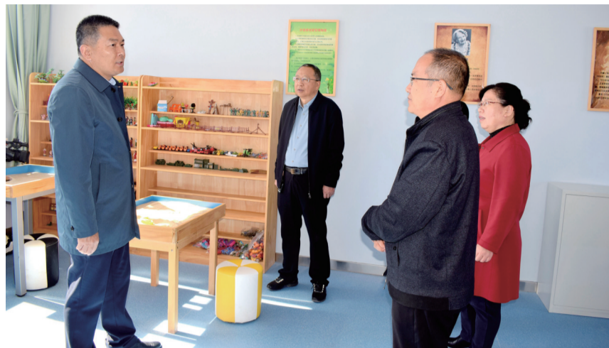
县委副书记、县长王映中在学校指导工作