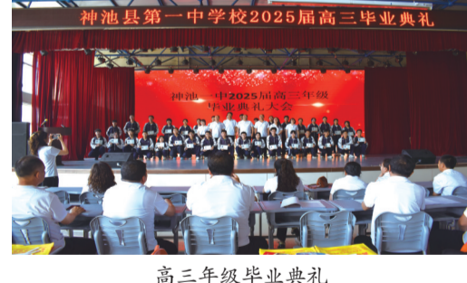
高三年级毕业典礼