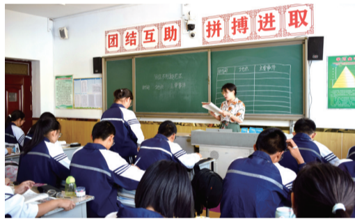
语文教学公开示范课