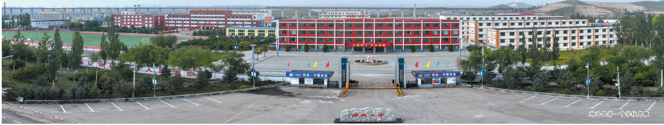
神池县第一中学校鸟瞰